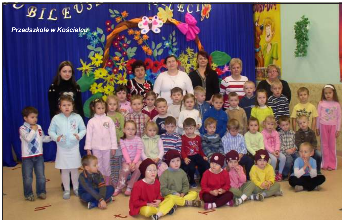
Przedszkole w Kościelcu