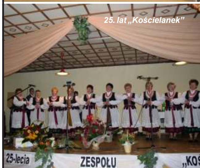
25. lat „Kościelank”