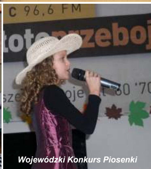
Wojewódzki Konkurs Piosenki