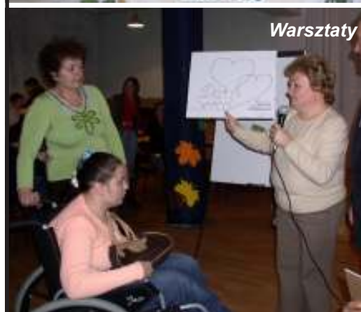
Warsztaty w Stowarzyszeniu